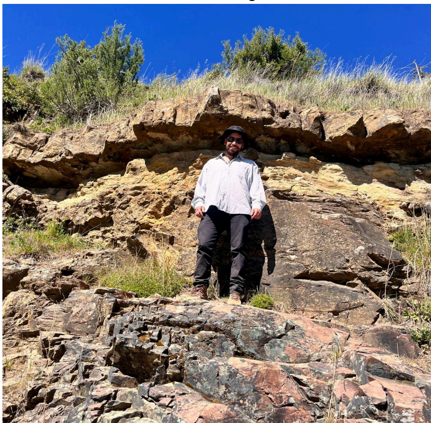
Discordancia de la Orogenia Andina

Un poco más alejado, en sectores extraandinos, a unos 120 km al este, el río Chubut atraviesa la caldera de Piedra Parada, megaestructura volcánica, eocena, en la cual se destacan restos de formas endógenas como los domos riolíticos y vitrofíricos, mantos ignimbríticos y coladas lávicas. Las salidas de campo propuestas recorren este sector, que coincide con la nueva Zona (9) de la Ruta del Valle Gondwana (ver mapa y para conocer más, click aquí ).